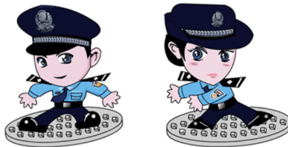
Abbildung 2: Internetpolizei als Mittel zur Selbstzensur - JingJing und Chacha

Abbildung 2 stellt JingJing und Chacha dar. Beide Comicfiguren sehen sehr sympathisch aus und strahlen trotzdem die Strenge der polizeilichen Autorität aus. Dies ermöglicht es sogar, dass Kinder die mit dem Internet aufwachsen, erst gar nicht die Restriktionen zu Hinterfragen lernen, sondern von klein auf daran gewöhnt sind, dass es einen Verhaltenskodex im Internet gibt, der von der Polizei überwacht wird. Somit stellt die Internetzensur für die heranwachsende chinesische Gesellschaft den Normalfall dar. Die Zensur wird für gerechtfertigt gehalten und somit kommt erst überhaupt niemand auf die Idee nach „chinafeindlichem“ Material zu suchen. Sollte dann jemand durch Zufall auf eine chinafeindliche Website gelangen, greift die Firewall und unterbindet den Zugang.